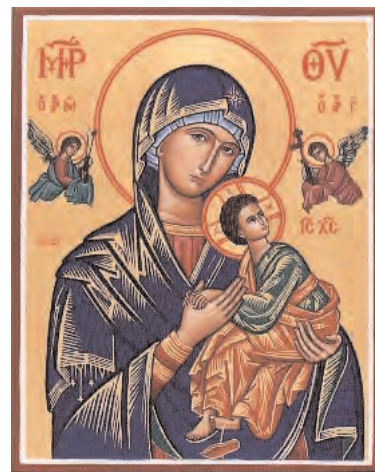
Notre-Dame du Perpétuel Secours, milieu du XVe siècle.

L'IDOLE de Robert MERLE, roman, éditions Presses Pocket 1989 à la page 327.